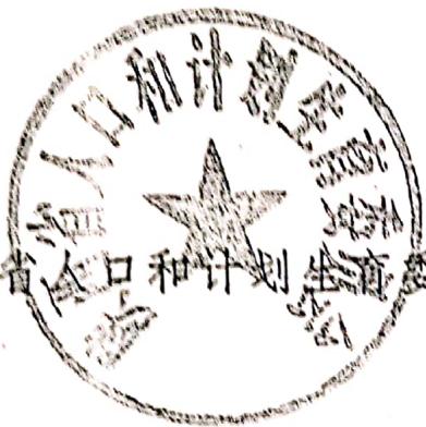
陕西省人口和计划生育委员会

各级人口计生、人力资源社会保障、民政、财政等部门要高度重视，加强协调，相互配合，认真落实有关政策规定，切实做好城市独生子女父母补助金发放工作。